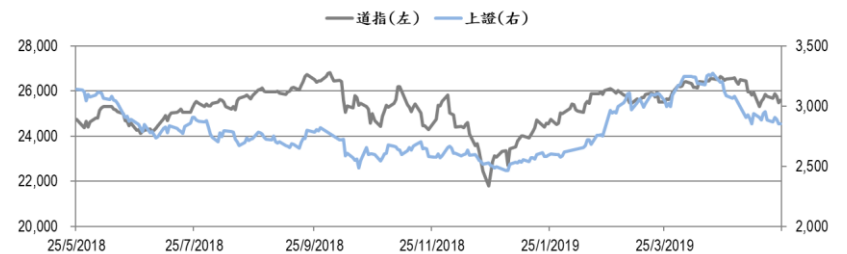
圖一：道瓊工業平均指數及上證綜合指數的一年期變化