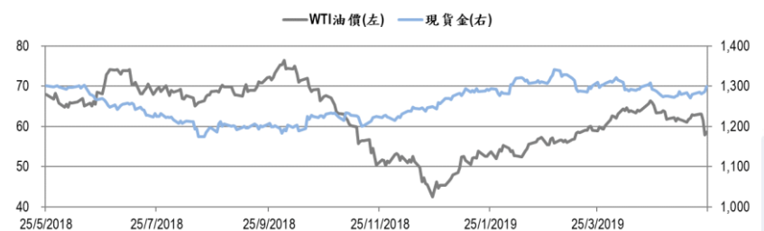
圖二：WTI 原油期貨及現貨金的一年期變化