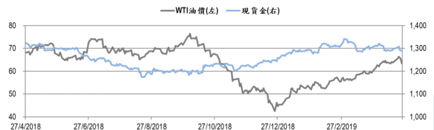
圖二：WTI 原油期貨及現貨金的一年期變化