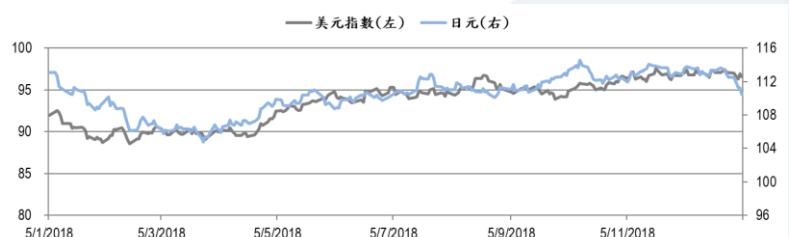
圖三：美元指數及美元/日元的年一期變化