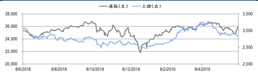
圖一：道瓊工業平均指數及上證綜合指數的一年期變化