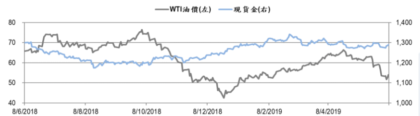
圖二：WTI 原油期貨及現貨金的一年期變化