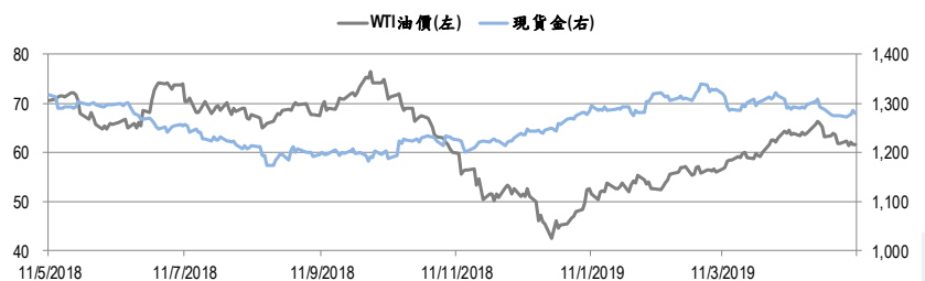
圖二：WTI 原油期貨及現貨金的一年期變化