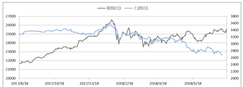
圖一：道瓊工業平均指數及上證綜合指數的一年期變化