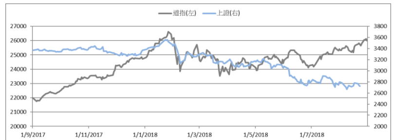
圖一：道瓊工業平均指數及上證綜合指數的一年期變化