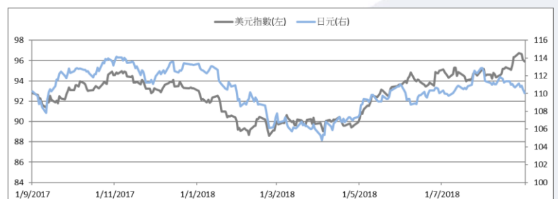
圖三：美元指數及美元/日元的一年期變化