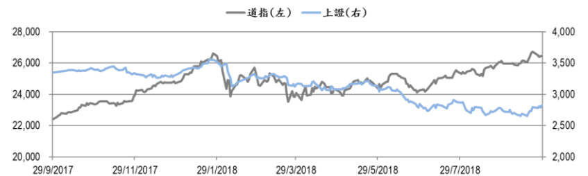
圖一：道瓊工業平均指數及上證綜合指數的一年期變化